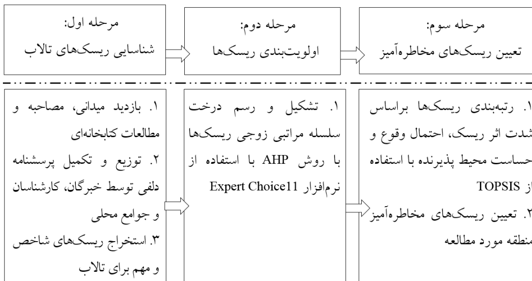
شکل ۲. مراحل انجام پژوهش

به‌خود اختصاص داده‌اند و سایر ریسک‌ها در رتبه‌های بعدی جای دارند (جدول ۵).