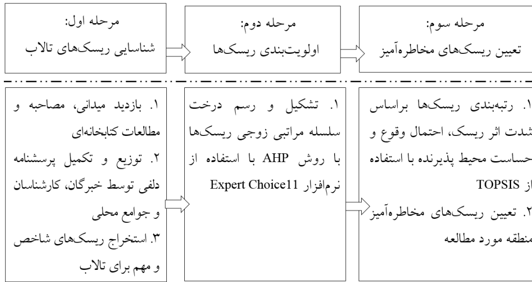
شکل ۲. مراحل انجام پژوهش

به‌خود اختصاص داده‌اند و سایر ریسک‌ها در رتبه‌های بعدی جای دارند (جدول ۵).