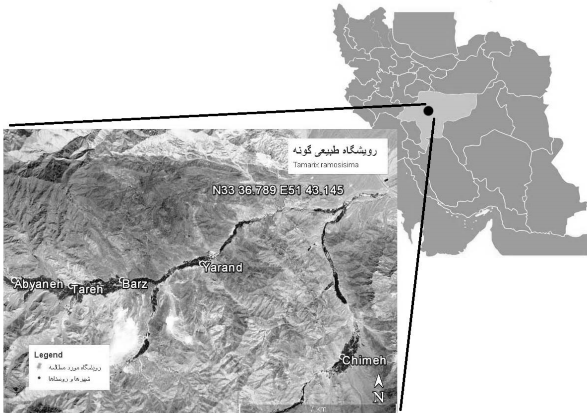
شکل ۱. نقشه منطقه مورد مطالعه