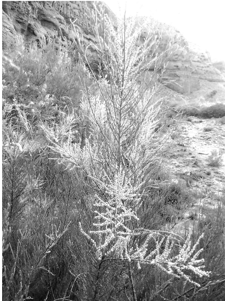
شکل ۱. تصویری از درختچه گز پرشاخه در رویشگاه طبیعی مورد مطالعه