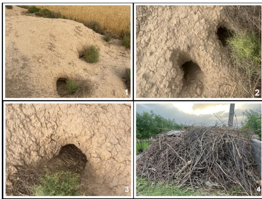
شکل ۲. ورودی لانه خدنگ بزرگ. (۱): لانه خدنگ با ورودی‌های متعدد در کنار زمین‌های کشاورزی، (۲ و ۳): لانه‌سازی در بافت نرم خاک زمین‌های کشاورزی، (۴): وجود پشته بزرگ پسماند کشاورزی و ایجاد مکان مناسب برای لانه‌سازی خدنگ