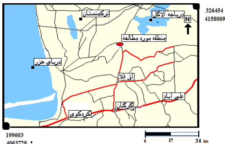
شکل ۱. نقشه موقعیت جغرافیایی منطقه مورد مطالعه در استان گلستان