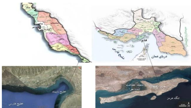
شکل ۱. مناطق مورد مطالعه، سمت راست منطقه حفاظت شده حرا در جزیره قشم و سمت چپ خلیج نایبند در منطقه عسلویه