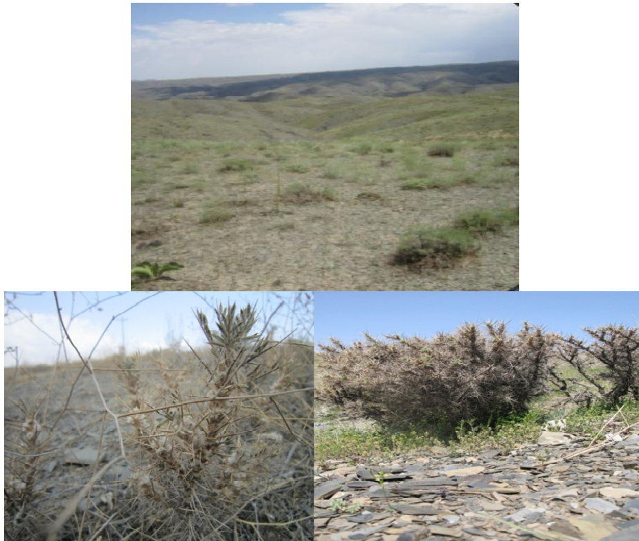
شکل ۱. سیمای منطقه (بالا) و تصویری از گونه Astragalus verus (پایین)