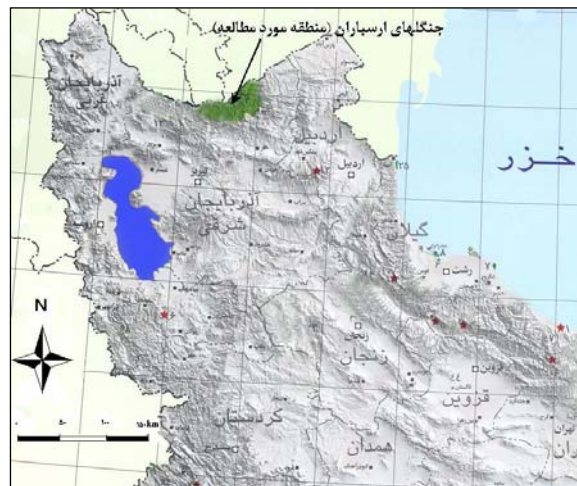
شکل ۱. موقعیت منطقه ارسباران در شمال غرب کشور