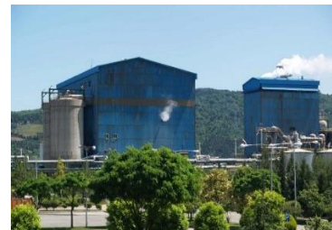
واحدهای تولیدی، کارخانه چوب و کاغذ