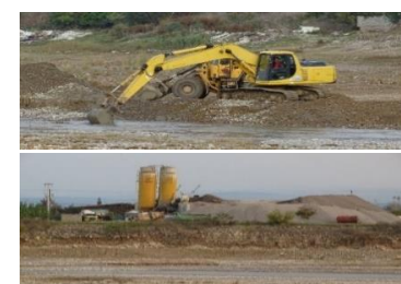
برداشت شن و ماسه و واحد شن شویی