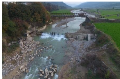
پل‌ها و موانع در حوضه آبریز تجن