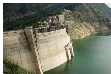
سدسازی - سد سلیمان تنگه