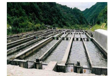
تراکم کارگاه‌های پرورش ماهی

شکل ۲. تصاویر مربوط به برخی از مخاطرات محیط زیستی موجود در حوضه رودخانه تجن و مصب آن، واقع شده در حوضه جنوبی دریای خزر