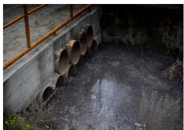
انتشار و دفع پساب و پسماند