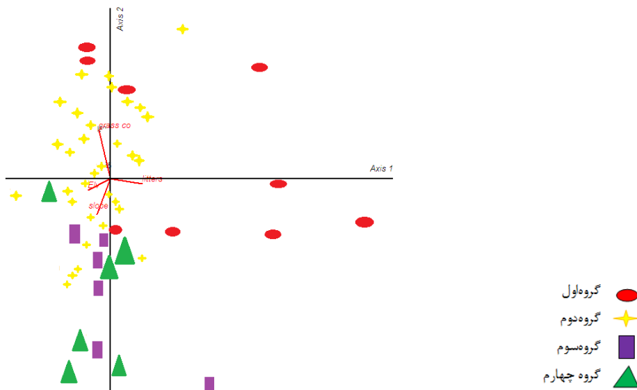
شکل ۲. وضعیت پراکنش گروه‌های اکولوژیک و ارتباط آنها با عوامل محیطی براساس آنالیز CCA

گروه چهارم: گروه Salvia reautreana . این گروه نیز شامل ۶ قطعه نمونه می‌باشد که در دامنه‌های شمالی و شمال شرقی و در مناطق مرتفع قرار گرفته‌اند و دارای بیشترین تعداد گونه‌های شاخص می‌باشد که این گونه‌های عبارت‌اند از: